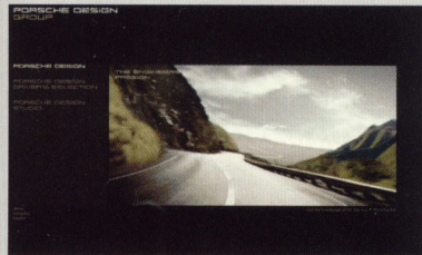
PORSCHE DESIGN www.porsche-design.com