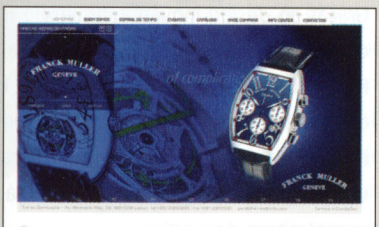
TORRES DISTRIBUIÇÃO www.torresdistrib.com