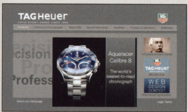
TAG HEUER www.tagheuer.com